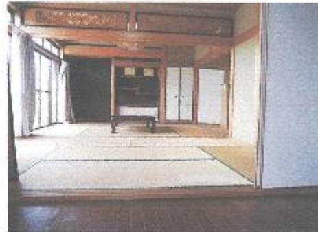
【座敷(二間続き)・床の間】