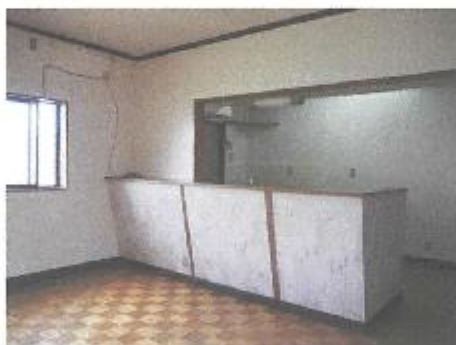
【リビング・ダイニング】