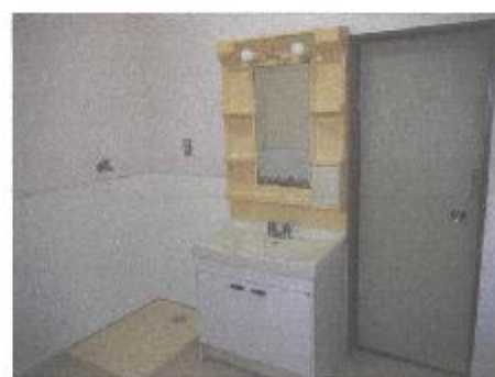
【洗面室・洗濯機置場】