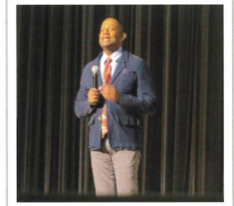
羽衣国際大学教授・タレント にちゃんたさん