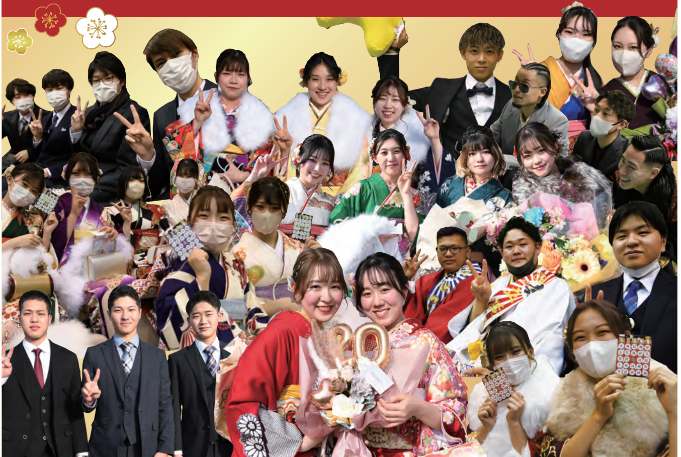
※写真撮影時のみマスクを外しています。

■町の人口(令和4年12月31日現在) 男 7,322人 女 7,673人 14,995人 前年同月より152人減 ■世帯数 6,685世帯 ■町の面積 25.26km 2