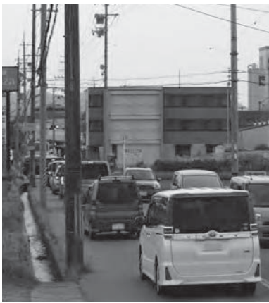
現在の柏原駒ヶ谷千早赤阪線

スに交通系ＩＣカードが利用できるシステムを導入しました。利用者の利便性向上のため、カナちゃんバスとやまなみタクシーの運行状況などをスマートフォンで確認できるバスロケーションシステムを導入します。