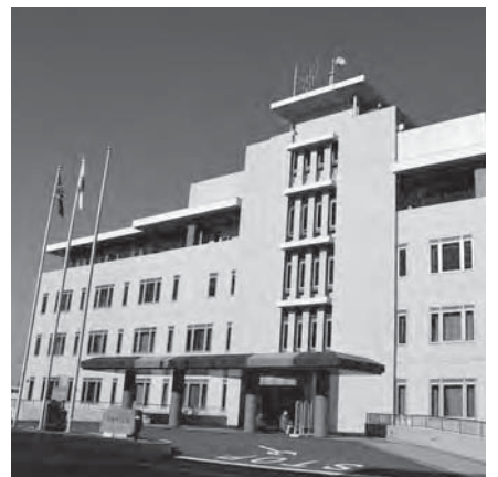
デジタル窓口システムの導入へ

令和4年3月にゼロカーボンシティを宣言しました。住民、事業者、行政が一丸となつてゼロカーボンシティを実現するため、ロードマップを作成し、引き続き、太陽光発電システムの設置補助や公用車への電気自動車の導入、新たに電気自動車等充電設備の設置補助を行うなど、二酸化炭素排出実質ゼロに向けた取り組みを行います。