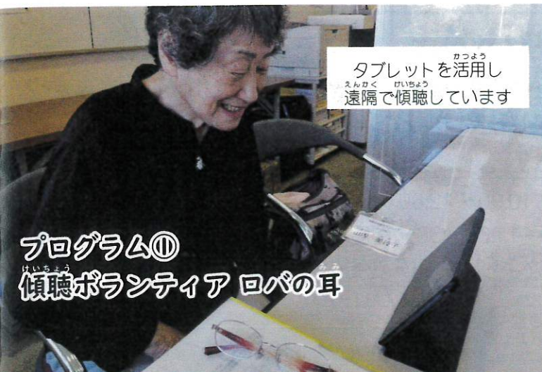
タブレットを活用し 遠隔で傾聴しています