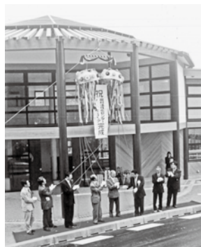
▲平成16年道の駅かなんオープン