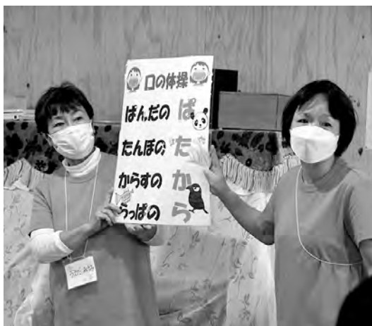
▲誤嚥などを防ぐための口の体操