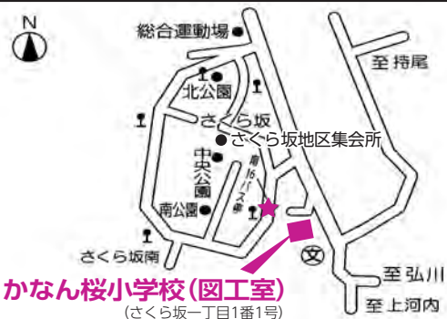
かなん桜小学校(図工室) (さくら坂一丁目1番1号)