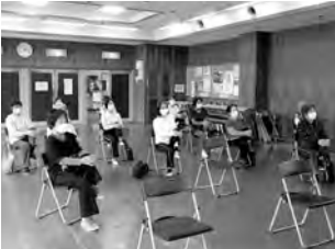
▲大宝地区(大宝公民館での実施グループ)は4年目