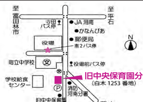
旧中央保育園分室 (白木1253番地)