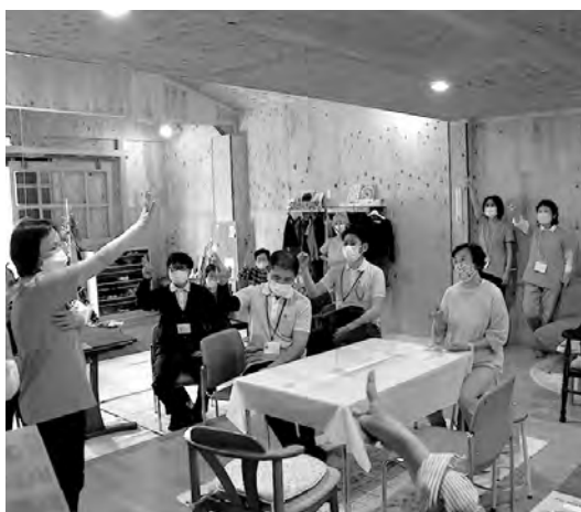
▲後出しじゃんけんで脳トレ