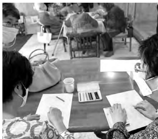
▲塗り絵で楽しく認知症予防