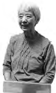
眞弓さんは同会の会長