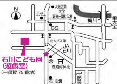
石川こども園(遊戯室) (一須賀76番地)