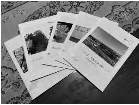
旅の思い出『といさんぽ』 旅先で撮った写真をアルバムに