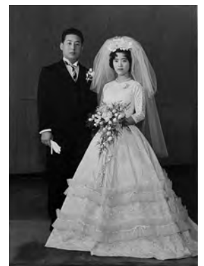
馴れ初めは、お見合い

頼りとなる一家の大黒柱が、認知症と診断された眞弓さん。しかし、悲観している様子はありません。 「夫は、7年程前から行き先や人の名前がわからなくなるなどの症状が見受けられました。今では、石けんや洗剤などの異物を食べたり、『家に帰る』と言っては、自宅周辺を徘徊して、警察に保護されたり、近所の方に気付いてもらい自宅に連絡してもらったりと、とにかく目が離せません。」