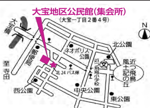
大宝地区公民館(集会室) (大宝一丁目2番4号)