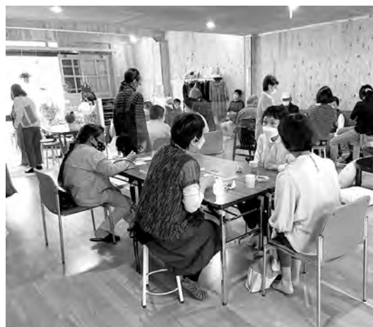
▲おしゃべりしながら気軽に交流