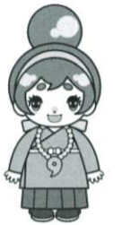
河南町のカナちゃん

町の事業に参加してスタンプをもらい、自分で決めた健康目標を実施して、記念品をもらいましょう！詳しくはかなん健康マイレージのカードをご覧ください。