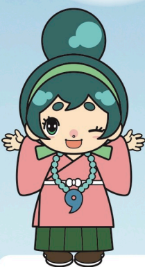
河南町のカナちゃん