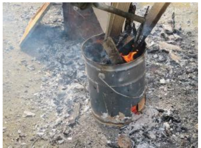
木くずなど廃棄物の焼却による暖取り