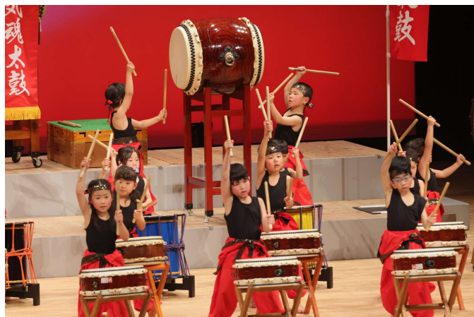
わくわく音楽会(すばるホール)