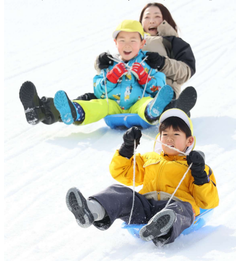
お別れ遠足(六甲山)