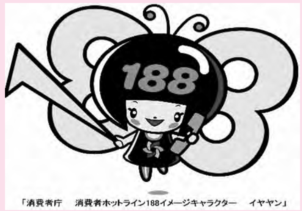
「消費者庁 消費者ホットライン188イメージキャラクター イヤヤン」

一人で悩まずに、全国どこからでも3桁の電話番号でつながる消費者ホットライン「188(いやや!)」に相談してください。