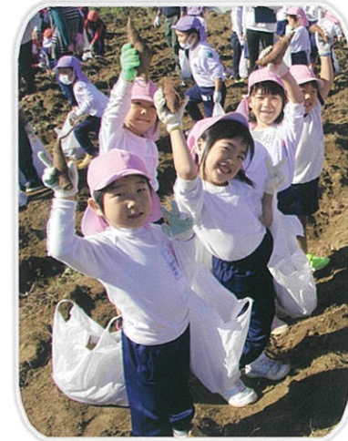
「老人会によるイモ掘り体験」令和2年10月27日