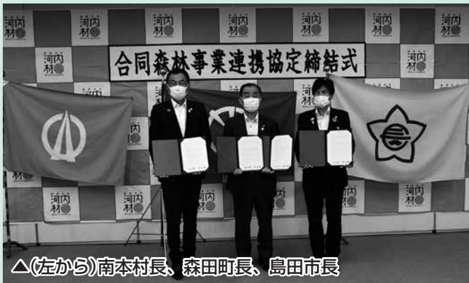
△(左から)南本村長、森田町長、島田市長