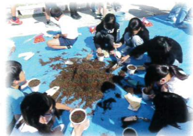
「人権の花」運動の様子・近つ飛鳥小学校にて

★令和5年10月20日 かなん桜小学校 ★令和5年10月26日 近つ飛鳥小学校 にて開催しました。