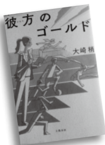
かなた 彼女がゴールド おおさき 梢 著

野球もサッカーも知らずスポーツ雑誌に配属された明日香。彼女には、ある競技に纏わる苦い思い出が…。スポーツの舞台裏に新米記者が飛び込む! 雑誌現場のお仕事小説。