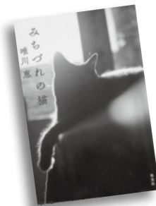
ねこ みちづれの猫 ゆいかわ けい 唯川 恵 著

実家の猫に死期が近いことを母親から知らされ、私は東京から金沢に向かうが…。「ミヤアの通り道」をはじめ、猫に寄り添われ救われてきた女性たちを描く7編の短編集。