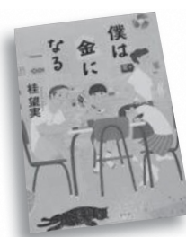
僕は金になる 桂 望美 著

「ご立派」な母ちゃんと離婚して家を出た父ちゃんは、将棋の天才の姉ちゃんに賭け将棋をやらせて暮らしている。母ちゃんと暮らす「普通」の僕は、二人を軽蔑しながらも羨ましくて…。