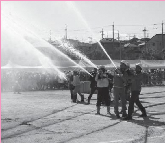
※写真は平成28年度訓練の様子