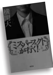
ミス・パーフェクトが行く! よこざき だい 著 横関 大 著

厚生労働省雇用環境・均等局総務課所属のキャリア官僚真波莉子。進むところ敵なしの彼女は、外交、経済、パワハラ、セクハラなど、さまざまな問題を解決し…。令和のパーフェクトヒロイン誕生! 華麗なる世直しエンタメ。