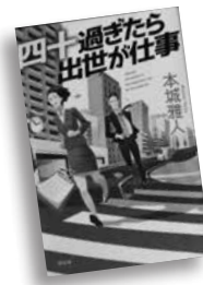
過ぎたら出世が仕事 よんじゅう 四十過ぎたら ほんじょう まさと 著 本城 雅人 著

課長になって早々に前代未聞のトラブルを抱えた阿南、無能な上司に怒りが収まらない課長の石渡…。阿南たちは同じ節目を迎えた仲間と悩み、ぶつかりながら奮闘する。