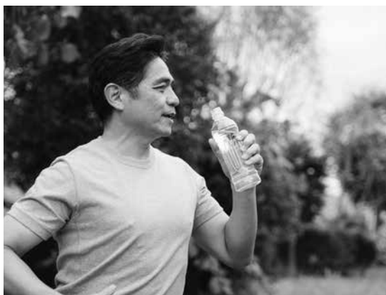
△こまめに水分補給を