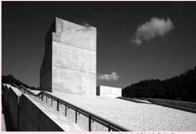
ちめのがたすえむら