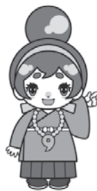
河南町のカナちゃん