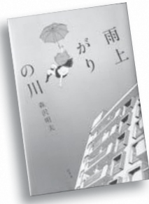
雨上がりの川 もりさわ あきお 著 森沢 明夫 著

サラリーマンの川合 かわい 淳 じゆん は、妻・杏子 きょうこ 、娘・春香 はるか とともに穏やかに暮らしていた。しかし、春香がいじめにあったことで「ふつうの幸せ」を失う。家族の絆を救ったのは、まさかの…。