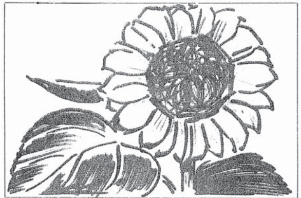
終戦の日「ひまわり」は全開だった

一九四二（昭和十七）年十月一日、浩三青年が兵士として徴集され、その出立の朝でした。家の前には、彼を歓送すべく地域の人びとが多く参集していました。