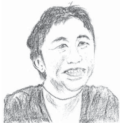
内藤大助氏のスケッチ像

二〇一二年秋、日経新聞の『男の子育て』と題した囲み記事に、元プロボクサー内藤大助氏の記録がとり上げられていました。氏はよくテレビに出演されますので、ご存知かと思いますが、ボクシングの世界では、日本フライ級王者、WBC世界フライ級王座を獲得し、五度もこの王座を守り抜かれました。二〇一一年に引退され、現在三十八歳で、ボクシングの解説者として活動しておられます。そして二人の男の子の父親でもあります。