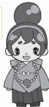
河南町のカナちゃん