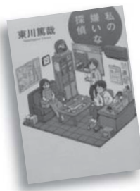
私の嫌いな探偵 東川 篤哉 著

うら若き美貌のビルオーナー二宮朱美は、間借りしている「鵜飼社夫探偵事務所」のせいで、とんでもない事件やドタバタに巻き込まれてばかり。今日もまた、探偵事務所を根底から揺るがす大事件が…!?