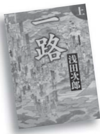
一路 (上・下) 浅田 次郎 著

いざ、江戸見参の道中へー。小野寺一路、19歳。父の不慮の死を受け、御供頭を継いだ若者は、家伝の「行軍録」を唯一の手がかりに、江戸への参勤交代を差配する。