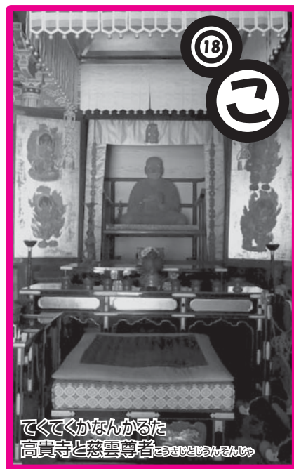
てくてくかなんから見た 高貴寺と慈雲尊者

長い歴史をもつ高貴寺には、さまざまな人物が関わっています。開基の頃(奈良時代)の役行者や空海に負けず劣らずと言えば、江戸時代後期の慈雲尊者(1718～1804)。