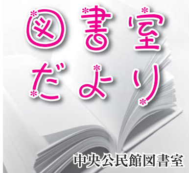
中央公民館図書室