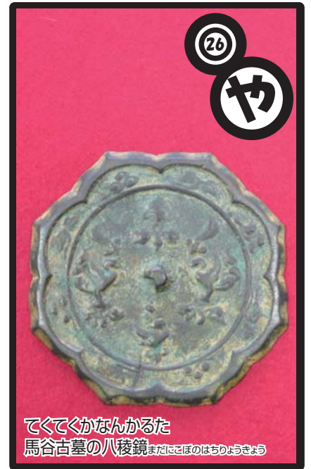
てくてくかなんからた 馬谷古墓の八稜鏡

お正月に見た着物や漆器などに、花や綬帯(紐)をくわえた鳥の文様がありませんでしたか?シルクロードから伝わったこの文様は、日本でも正倉院の宝物でおなじみです。