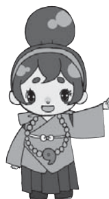
河南町のカナちゃん

▷宛先 ハガキ：〒585-8585(住所不要)河南町役場秘書企画課 河内弁クイズ係 FAX：(93)4691 Eメール：kouhou@town.kanan.osaka.jp