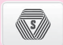
標準営業約款 (Sマーク)