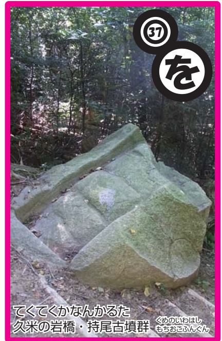
てくてくかなんかるた 久米の岩橋・持尾古墳群