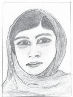
マララさんのスケッチ像