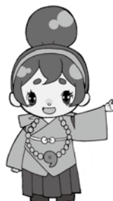
河南町のカナちゃん