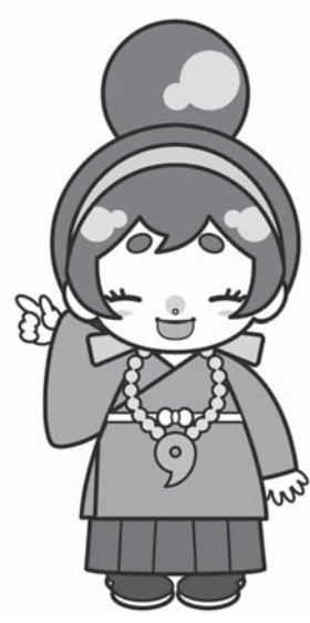
河南町のカナちゃん