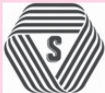
Sマーク (標準営業約款)

Sマークは、厚生労働大臣認可の標準営業約款に従って営業している理容店、美容店、クリーニング店、めん類飲食店、一般飲食店に付与されるマークです。