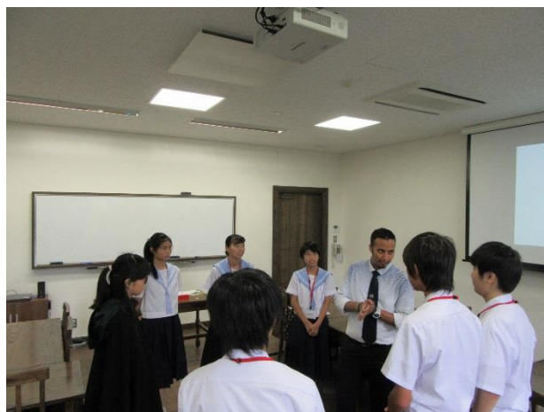
02 Lesson9 Speech Skills 2