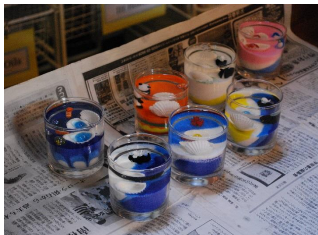
08 きれいな作品が完成！