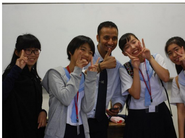
06 スピーチを終えてホッとひといき