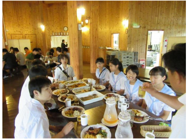
08 寄宿舍風 大皿料理