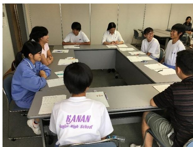
02 プリティッシュヒルズについて