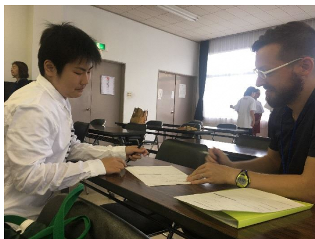
04 スピーチの原稿作成