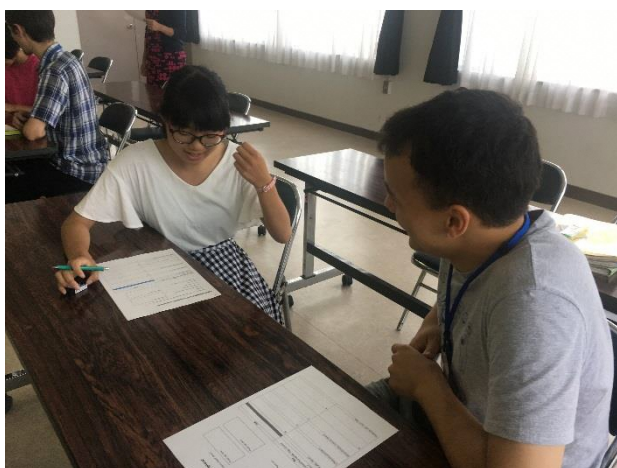
03 スピーチの原稿作成