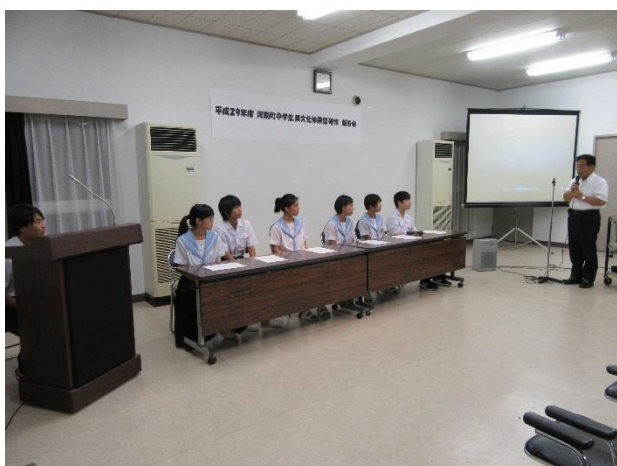
05 ありがとうございました