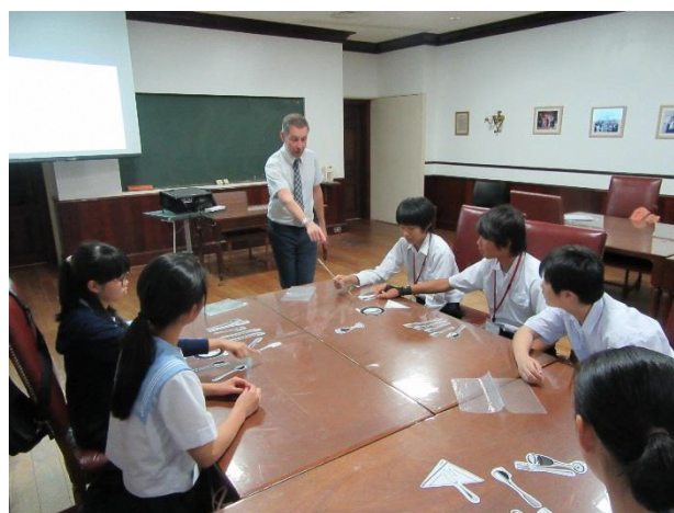
10 British style table manners in English