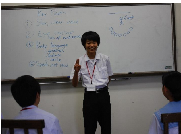
05 スピーチコンテスト!