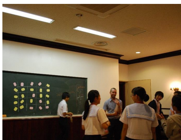
08 Lesson 4 Fun with Language