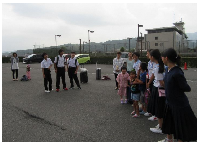
04 いい思い出になりました!