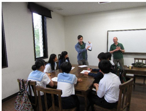
02 Lesson 5 Interview Orienteering