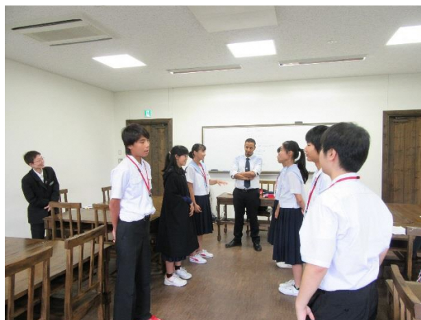
04 最後のスピーチ練習