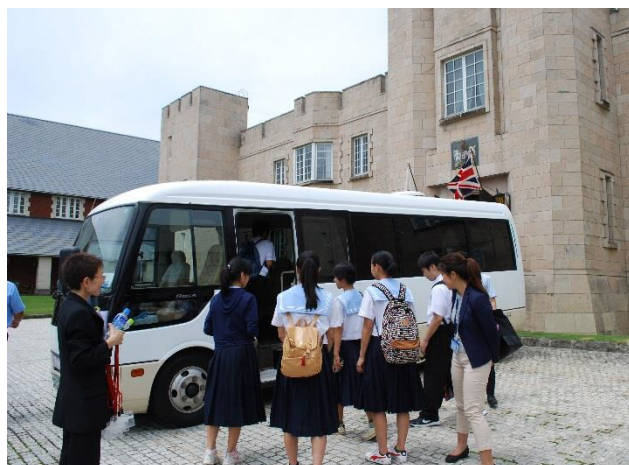
02 Depart from British Hills