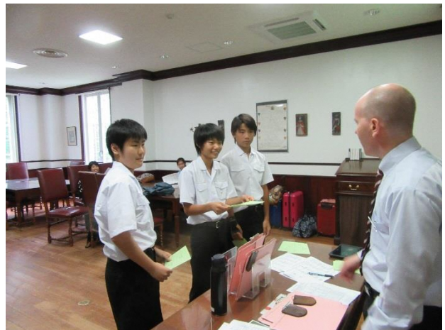
04 英語でチェックイン