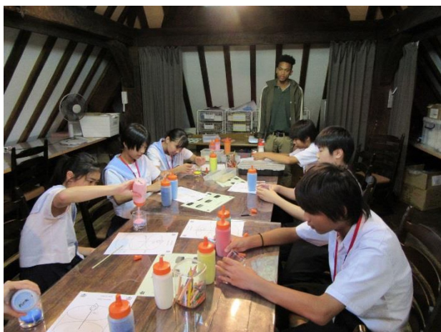
07 Lesson 10 Gel Candle-making