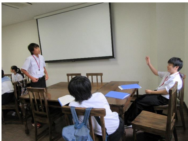
03 Lesson9 Speech Skills 2