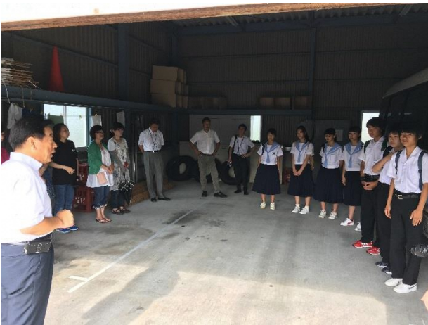
01 ブリティッシュヒルズへ出発