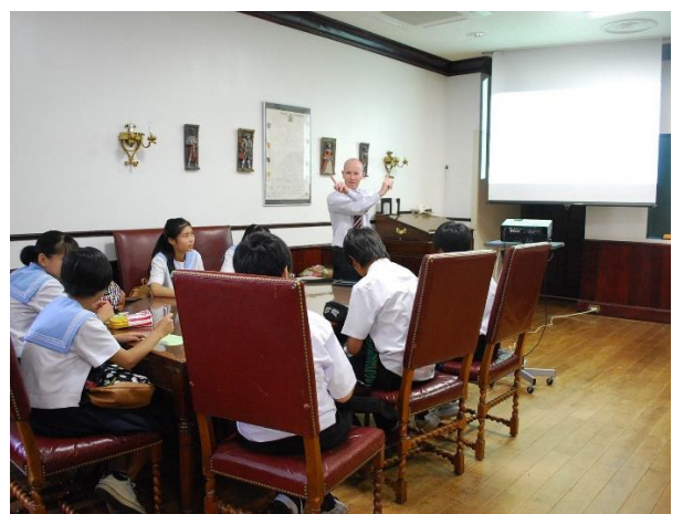
06 オリエンテーション