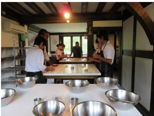
07 Lesson 7 Cooking scones