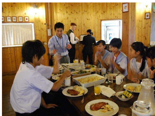
12 最後の Dinner