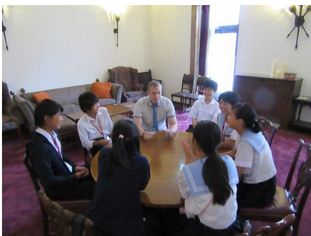
09 English Speaking Club