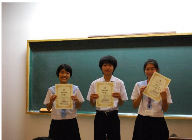
01 Announcement of speech skills winners with awards