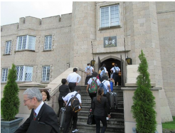
03 ブリティッシュヒルズに到着