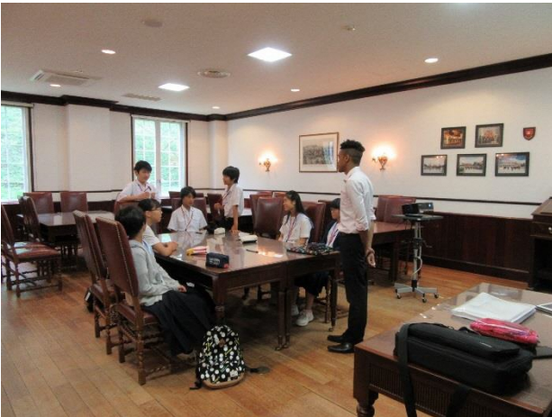
03 Lesson 1 Survival English