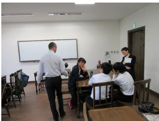
05 Lesson 6 Travel Abroad