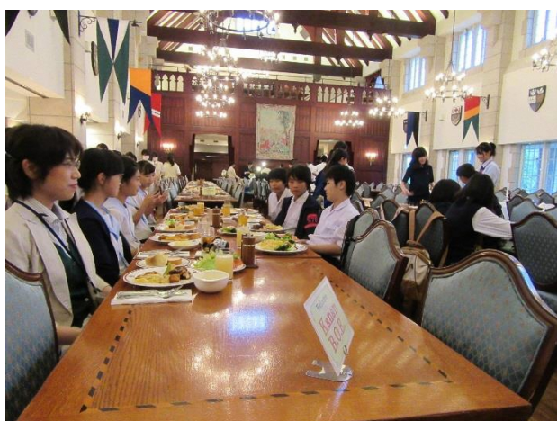
09 夕食 ビュッフェ