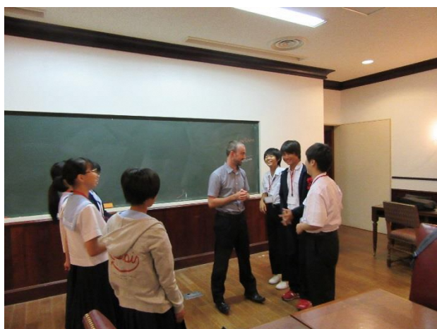
07 Lesson 4 Fun with Language