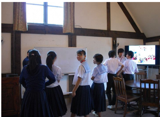
01 Lesson8 Describing people