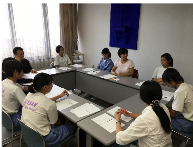
01 緊張の初顔合わせ