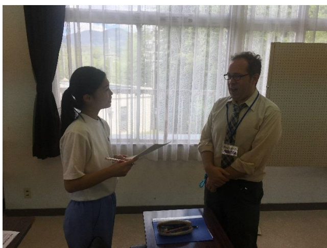
05 インタビューの実施