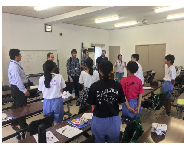
06 プリティッシュヒルズに向けて！