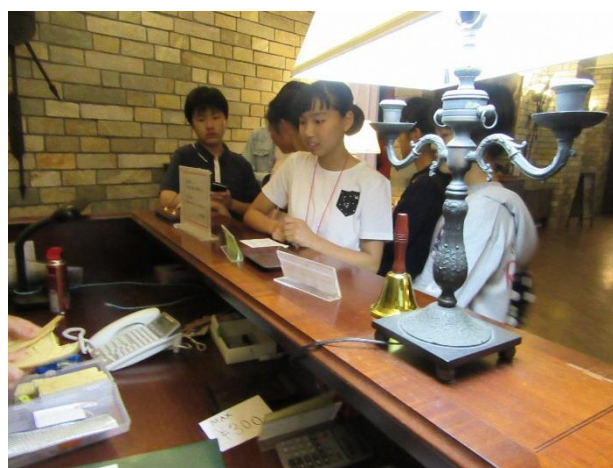
10 ショップで使えるお金に両替