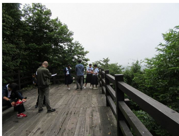
04 Lesson 5 Interview Orienteering