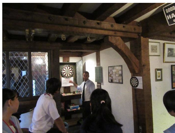
10 Lesson11 Pub Game