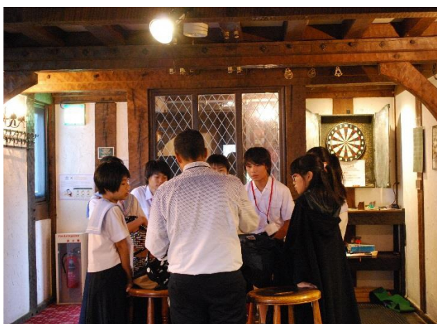
09 Lesson11 Pub Game