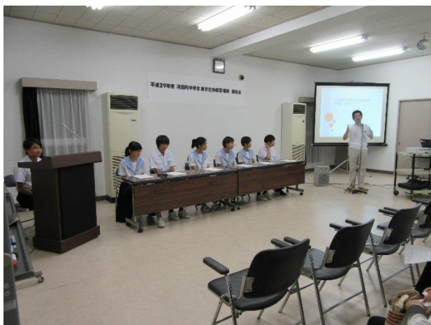
01 いよいよ報告会です