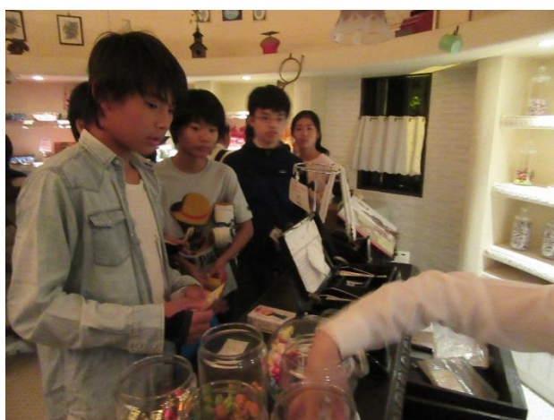
11 キャンディーの量り売り