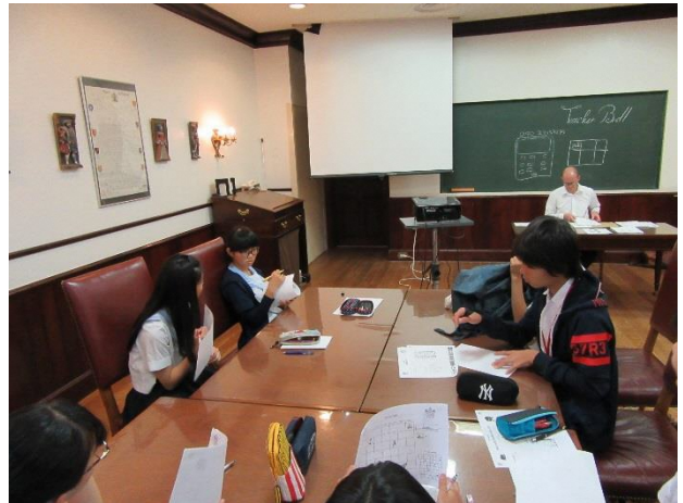
04 Lesson 2 Pronunciation Skills