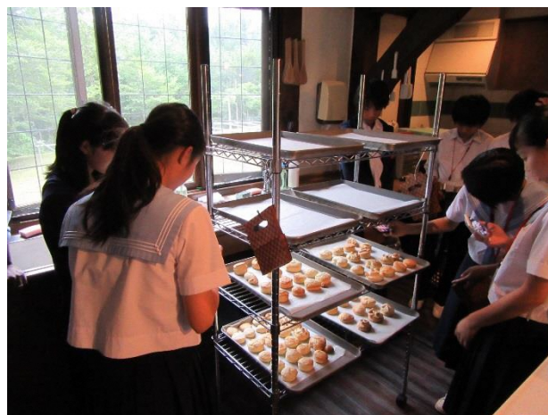
08 Lesson 7 Cooking scones