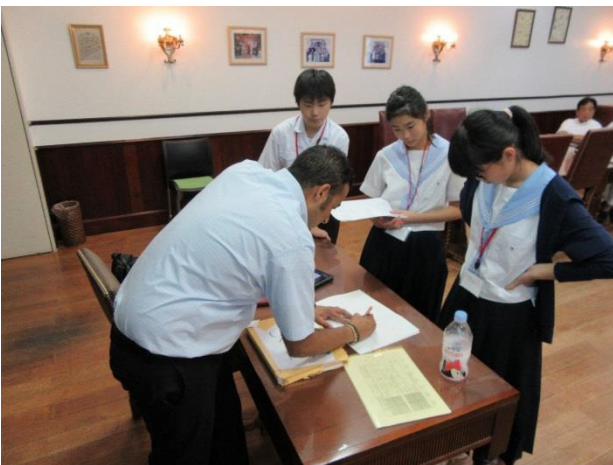
05 Lesson 3 Speech Skills 1