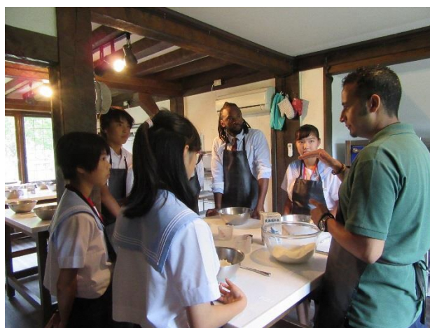
06 Lesson 7 Cooking scones