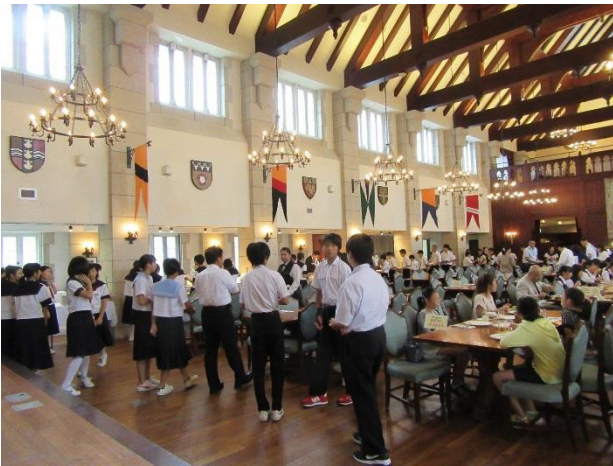
01 朝食 ビュッフェ