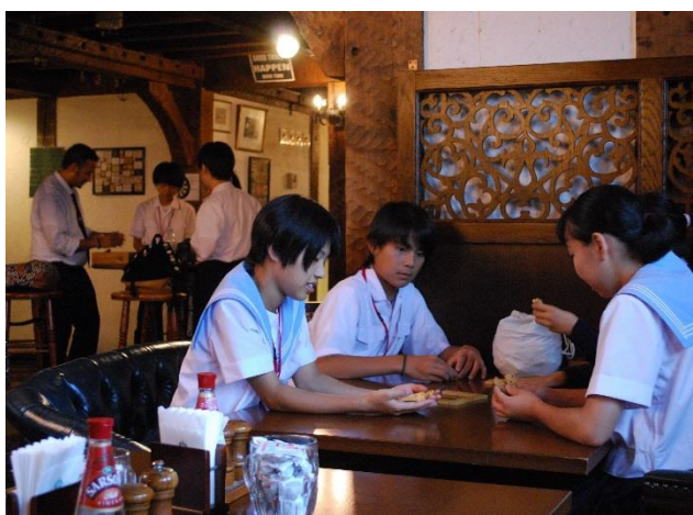
11 本当のドミノの遊び方