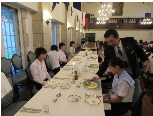
11 Plate dinner