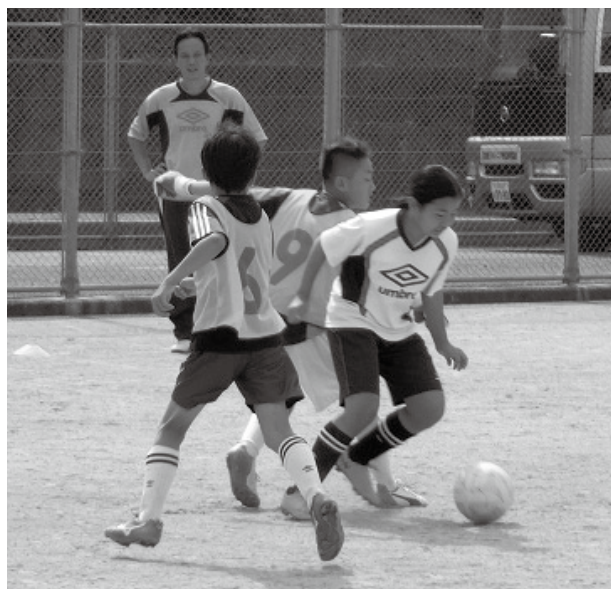
クラブサッカー風景

問 日本の学校は明治時代以来、全ての問題を校内で解決しようと抱え込み、何から何まで教員がやってきた。その責任感の強さが、逆に問題を顕著化させず、「大過なく済ます」を第一に考える閉鎖的な体質を生んできた。長時間労働が社会問題になる中、河南町の教員の勤務実態は。 答 小・中学校、特徴があります。中学校で最も高150時間を超えている職員がいる。