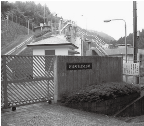
河南町青崩水源地

答 大変好評を博し、早朝より子どもからお年寄りまで多くの方が並ばれたため、少し早めて販売を開始した。夏場なので、ミストファンで待合スペースの暑さ対策に努めたが、並んだ方にはご不便をお掛けした。