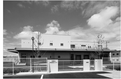
河南町立学校給食センター