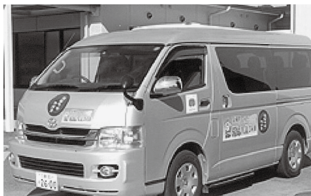
玉城町オンデマンドバス

進めるのは、このままでは病院や買い物のままならなくなるという危機感があるわけである。運転免許の自主返納の高齢者も10年前の10倍以上になつており、高齢者の方が外出したがいなくなる