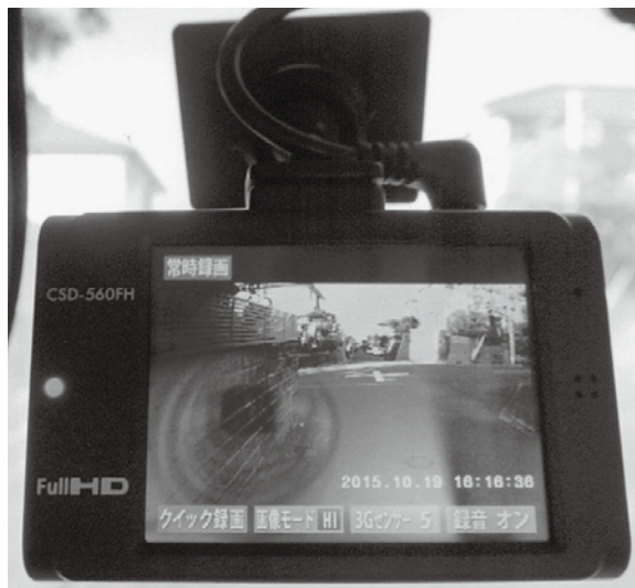
ドライブレコーダー

等での購入も可能なことから、自家用車への取り付けも比較的容易になってきた。公用車も例外ではなく、導入を進める自治体が増えている。そこで、本町でも住民の安心安全の観点から、是非取り入れてはどうかと考える。公用車はもとより、現在町内5か所に貸与している青色防犯パトロールカーへの導入によりこれまで以上の犯罪抑止が図れると考えるが。