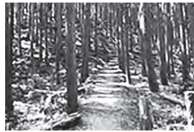
美しい森林を守るために （岩橋山登山道）

問 補助金を有効に使い、防災対策の充実を図れないか。 答 大阪府では、危険渓流についての調査および