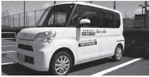
ラクチンライフサポート事業の運送車両