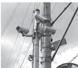
修繕費などにも補助を

答 電気代の補助はしているが、ハードディスク破損対応として、要綱を見直し、今年度より補助していく。