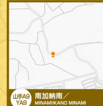
山手A9 YA9 南加納南/ MINAMIKANO MINAMI