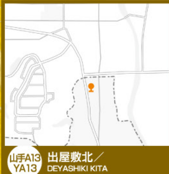
山手A13 YA13 出屋敷北/ DEYASHIKI KITA