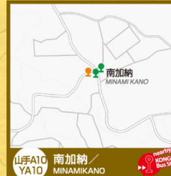
山手A10 YA10 南加納/ MINAMIKANO