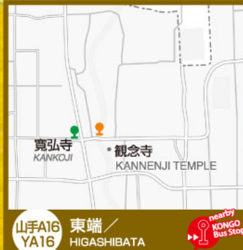
山手A16 YA16 東端/ HIGASHIBATA