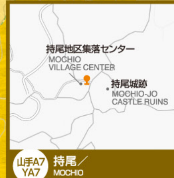
山手A7 YA7 持尾/ MOCHIO

凡例/The key on this map ● やまなみタクシー(A)停留所 Yamanami Taxi(A) Taxi Stop