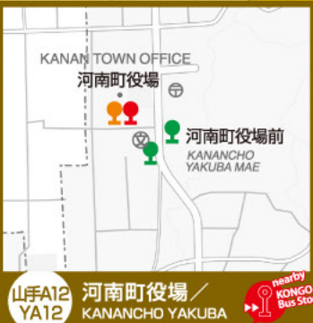
山手A12 YA12 河南町役場/ KANANCHO YAKUBA