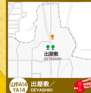
山手A14 YA14 出屋敷/ DEYASHIKI