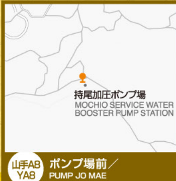
山手A8 YA8 ポンプ場前/ PUMP JO MAE