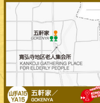
山手A15 YA15 五軒家/ GOKENYA