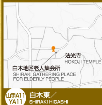
山手A11 YA11 白木東/ SHIRAKI HIGASHI