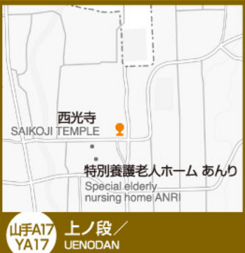
山手A17 YA17 上ノ段/ UENODAN

凡例/The key on this map ● カナちゃんバス バス停/Kanachan Bus Stop ● やまなみタクシー停留所/Yamanami Taxi Stop ● 金剛バス バス停/Kongo Bus Stop