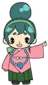
河南町のカナちゃん

※ 実証運行期間：平成28年2月2日（火）～平成29年1月31日（火） ※ やまなみバスは廃止します。